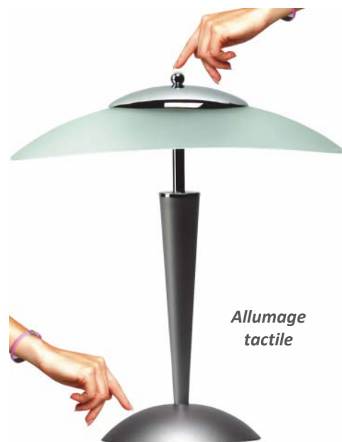
Vasque oblongue en verre dépoli