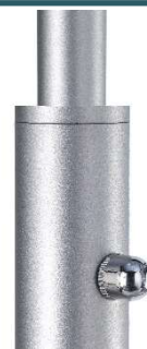
Drehdimmer am Mast