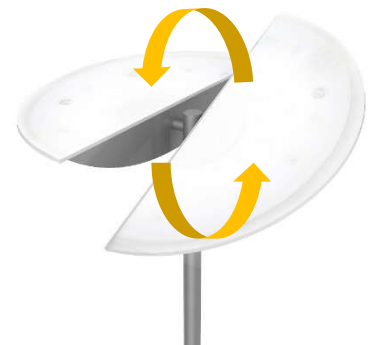
Unabhängig voneinander drehbare Lichtschalen

Die geteilte Lichtschale und die Milchglasabdeckung über den LED-Modulen gibt ZELUX eine elegante Optik. Dank des platzsparenden Fußes findet die Leuchte überall Platz.